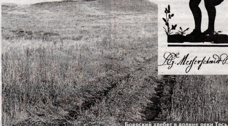
Боярский хребет в долине реки Тесь.