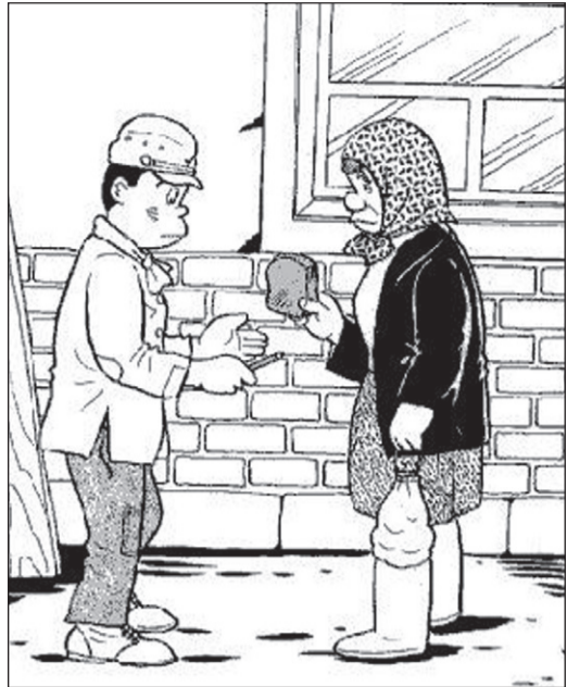
Сибиряки относились к пленным японцам сочувственно: многие позже не раз вспоминали, как местные жители делились с ними едой или табаком