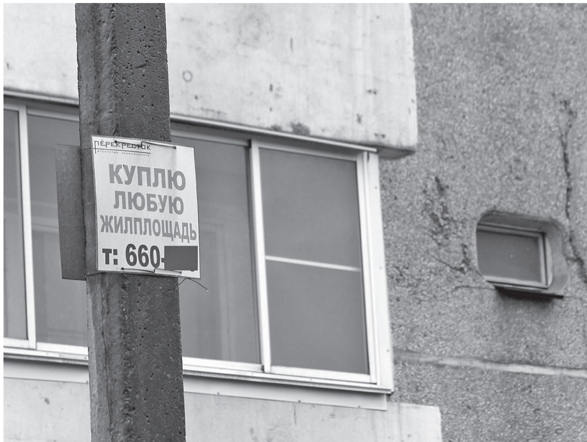
Жертвами мошенников, отмечают специалисты, становятся не только покупатели, но и продавцы недвижимости. Имущество без ведома собственника продают дети, супруги, другие самые близкие люди

Покупателя земельного участка в документе должна насторожить пометка «иные ограничения». Она применяется, если участок находится в водоохранной зоне, на его территории располагается памятник. Как правило, в правоустанавливающих документах у продавца отражено, какие именно имеются ограничения. Если вы готовы соблюдать определённые условия, можете не обращать внимания на эту пометку в выписке. Но лучше всё же проконсультироваться со специалистами: с полученной выпиской обратиться в Управление. Каждый начальник отдела по направлению государственной регистрации прав один раз в неделю ведёт личный приём граждан.