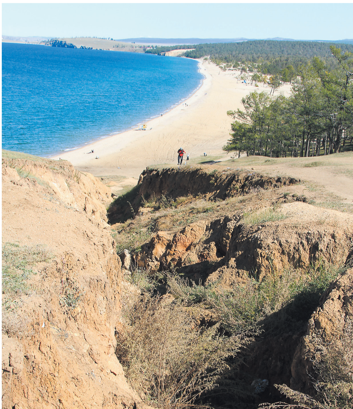
Муниципальные очистные сооружения, работающие на Байкале, почти не удаляют из стоков азот и фосфор