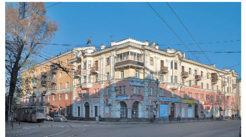
Пленные из Квантунской армии приложили руки к появлению на улице Ленина узнаваемых домов-«сталинок» и запуску трамвая в Иркутске