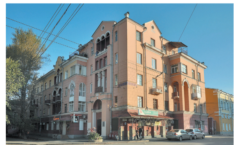
«Японцы ничего не могли добавить к проекту советского архитектора: как он нарисовал, так они и построили»